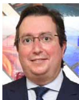
Presidente Graciano Estrada Trigueros