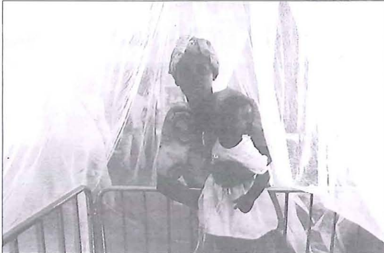
El 90% de las personas enfermas y de las muertes por malaria se producen en el África subsahariana.

"Si bien las causas de este estancamiento, que pone en serio peligro cumplir con los objetivos propuestos por la OMS en su 'Estrategia técnica global contra la malaria 2016-2030', son atribuibles a diferentes fac-