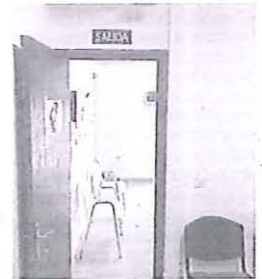
Consultorio de Roda. EL NORTE

La localidad, explica Palomo, «lleva con este deficitario servicio desde el mes de abril, ya que su médi-