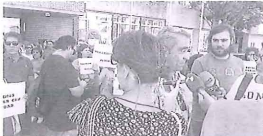
Participantes en la concentración de ayer.

Según recalcó, no todos los departamentos tienen cobertura «al cien