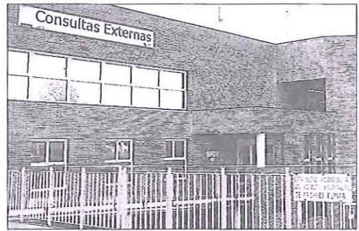
Los profesionales sanitarios buscan su futuro en otros países.

En cuanto a los destinos preferidos para trabajar en el extranjero, los dos primeros puestos no experimentan cambios,