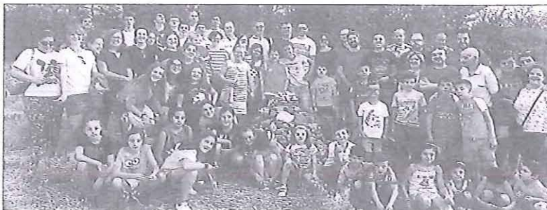
Vecinos de distintas edades convivieron en la jornada de educación ambiental sobre el mochuelo.

participantes, cerca de un centenar de personas, descubrieron a través de una charla, cómo es esta pequeña rapaz de formas rechonchas, su canto, alimentación, dónde y cómo vive y el estado de conservación de sus poblaciones; también conocieron su relación mitológica con la diosa Atenea. El programa de la Semana Cultural ha incluido una visita a la Fábrica de chocolate de Miguelañez, una marcha ciclo-turista, actuaciones musicales y comidas populares.