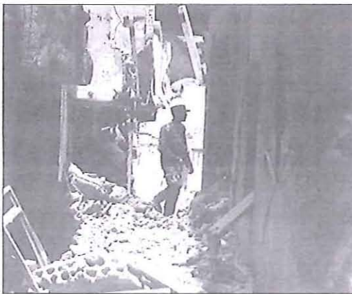
El conflicto en Yemen está afectando de forma grave a la población.

"Hay que llamar a puertas adecuadas", explicó a los medios, su-