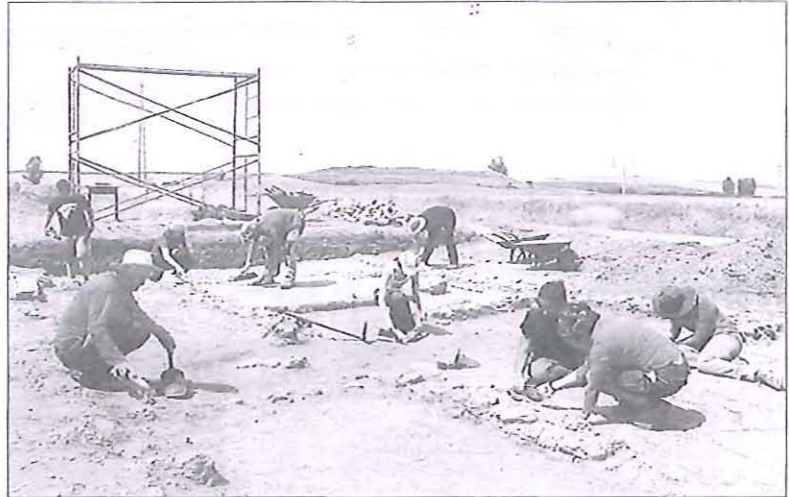
Las excavaciones en esta campaña han documentado la presencia de enclaves militares romanos.

En esta intervención arqueológica, financiada por el Ayuntamiento de Herrera de Pisuergra e IE University, los trabajos se han centrado en la documentación de restos materiales romanos de entre lo siglo I y V, destacando los resultados obtenidos para los siglos III y IV, apenas conocidos en los enclaves urbanos de la cuen-