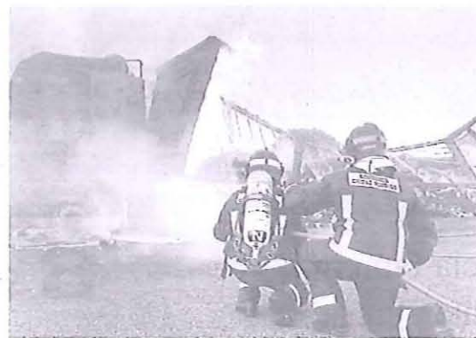
Los bomberos de Ciudad Rodrigo sofocaban las llamas del camión ardiendo en la carretera.

Hasta el lugar se desplazaron Guardia Civil de Tráfico y Emergencias Sanitarias Sacyl, que envió un helicóptero medicalizado para atender a los heridos. Entre ellos, una mujer de 20 años y un varón de 24,