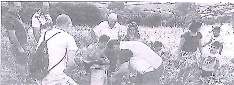
Colocación de piedras para levantar un majano e instalación de la caja nido.