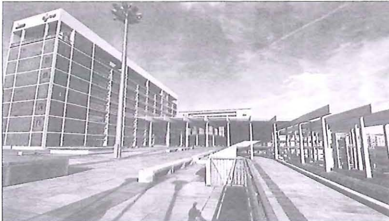
Los socialistas plantearán propuestas para que las Cortes reviertan el Hospital Universitario de Burgos.

Burgos y Soria se ha reforzado aún más la capacidad de plazas formativas, que ha pasado de nueve a 38 para médicos y de seis a 28 para enfermeras.