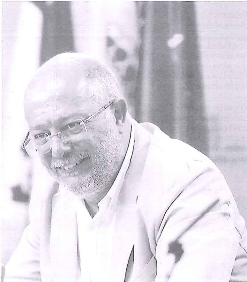
El vicepresidente de la Junta, Francisco Igea, se estrenó como portavoz tras el Consejo de Gobierno.

RESPUESTA LEGAL. Este proceso es «muy complejo, difícil y con una alta incertidumbre», pero en todo momento se ha de «respetar la dignidad de la persona», con el objetivo añadido de que los «dilemas» a los que se enfrentan las administraciones y los profesionales sanitarios en estos casos tengan una respuesta legal concreta, según manifiesta el borrador del anteproyecto.