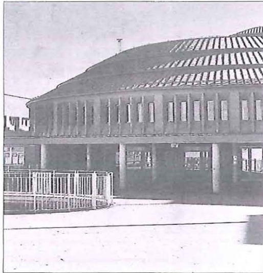
Hospital General de Segovia.

"La unidad de Radioterapia en Segovia, es uno de los incumplimientos a los que nos ha tenido acostumbrados el gobierno autonómico, que considera a nuestra tierra de segunda. La nueva responsable de la Consejería de Sanidad de la Junta, representante de Ciudadanos, deberá explicar sus planes para la instalación de una infraestructura tan necesaria como urgente en Segovia", han reclamado.