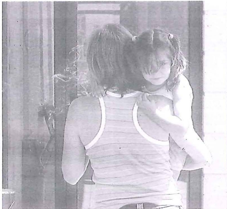
Una mujer acude con su hija al pediatra.

Ante estas quejas, el centro de salud de San Ildefonso dice que existe una imposibilidad material para cubrir las ausencias, y como alternativa ha propuesto diferentes soluciones. Las revisiones pediátricas programadas hasta los dos años de edad serán atendidas en los centros de salud de Segovia Rural, en turno de mañana, y Segovia III, en turno de tarde. En el caso de los mayores de dos años, se realizarán, previa cita, en el propio centro de salud de San Ildefonso. Aquí también serán las urgencias, como viene sucediendo durante la atención continuada, es decir, los días de diario de 15 horas a 8 horas del día siguiente, y las 24 horas de los sábados, domingos y festivos. Con respecto a las revisiones de enfermería pediátrica que se vienen alternando sistemáticamente con las revisiones, se man-