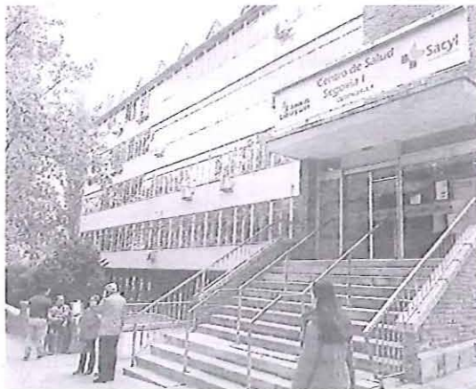
Acceso al centro de salud de Santo Tomás. A. DE TORRE

La organización sindical recuerda al gerente de Asistencia Sanitaria de Segovia, que es el máximo responsable provincial del Sacyl,