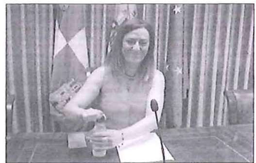
La delegada del Gobierno en Castilla y León, Virginia Barcones.

Frente a estas críticas, señaló que el Gobierno de España lo que hace es "trabajar por las personas", revertir los recortes que los ciudadanos, "sobre todo los más vulnerables", han sufrido durante todos estos años y para ello el Ejecutivo "cogerá el vehículo jurídico más oportuno" para poner encima de la mesa un acuerdo en torno a la senda del déficit.