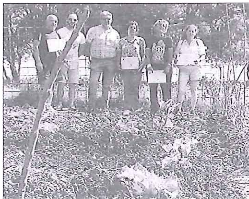
Los vecinos cuentan con el permiso de uso de los huertos municipales.

Los vecinos que han recibido la concesión de esta primera campaña de huertos ecológicos de ocio, hasta un total de nueve, han manifestado la ilusión que tienen con este proyecto. Se pretende además promover buenas prácticas ambientales de cultivo, gestión de residuos y ahorro de agua.