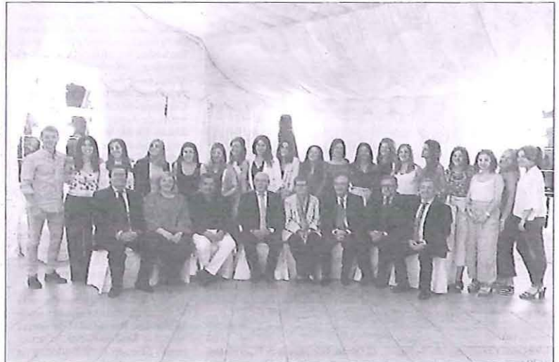
Foto de grupo tomada el pasado año en la festividad de la Virgen del Perpetuo Socorro, patrona de la profesión.