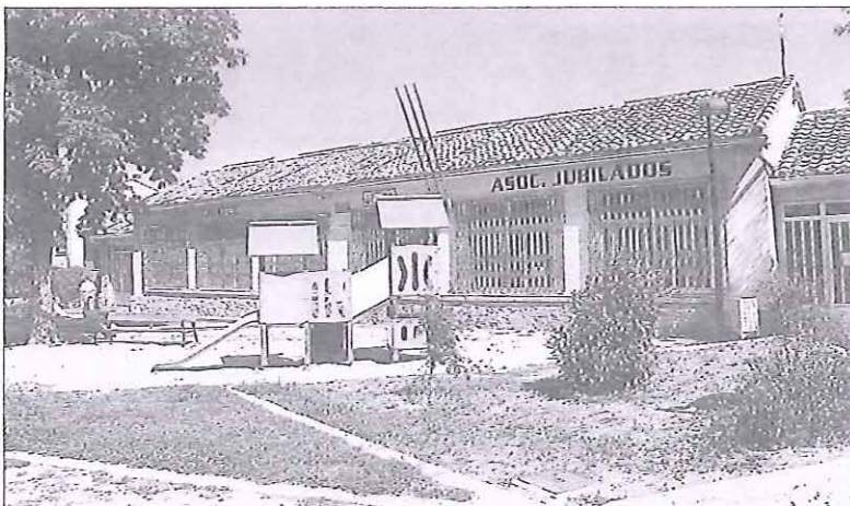
El edificio que acogía las sedes de asociaciones ha sido vaciado para proceder a su próxima demolición.

La creación de la infraestructura sanitaria costará uno 372.000 euros que serán financiados entre la Diputación de Segovia, la Junta de Castilla y León y el Ayuntamiento de San Cristóbal. La Diputación