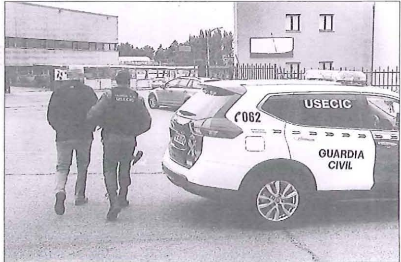
Momento en que los agentes de la Guardia Civil se llevan detenida a una de las nueve personas implicadas.

A raíz de detectar estas presuntas irregularidades, se solicitaron informes a los servicios técnicos y jurídicos de la Agencia Española de Medicamentos y Productos Sanitarios, así como a la Subdirección