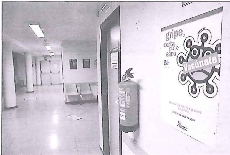
Sanidad mantiene abierta la posibilidad de vacunarse frente a la gripe aunque la campaña terminara el día 15.

La explicación en parte es debida a que los virus detectados en la Red Centinela son mayoritariamente del tipo 'B' y en menor medida del tipo 'A' que "es el que va a traer la epidemia más explosiva", según advierte Montarelo. El virus 'A', que se el que se asocia a la fuerte invasión gripal sufrida en Australia y que los epidemiólogos temen viaje de uno a otro hemisferio, ha aparecido por primera vez