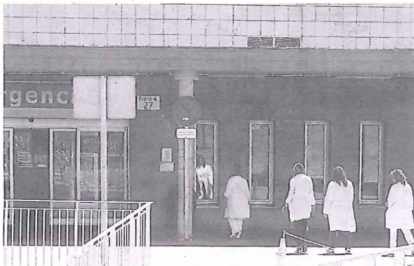
Personal sanitario se dirige a la puerta de Urgencias, en el Hospital General de Segovia.

Intereses ha habido, pero ninguno ha fructificado en la formulación de la consiguiente solicitud. Consultas también se han producido, pero hasta el momento, nada de nada. Y eso que en octubre se cumplirá el primer aniversario de la pu-