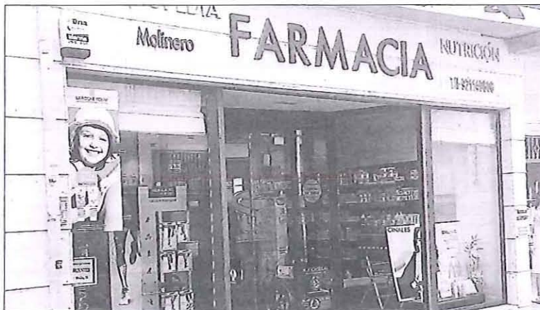
Las farmacias sirvieron en 2016 un total de 2.808.829 envases de medicamentos recetados en Segovia.

En segunda posición se situaron los medicamentos destinados a combatir los problemas gástricos —agentes para el tratamiento de la