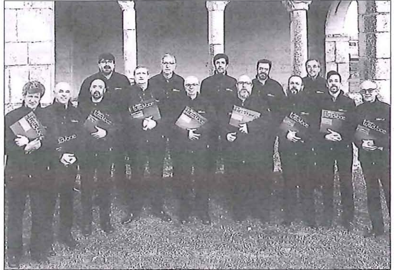
La formación segoviana Tutto Voce presentará en el Torreón 'Música y Poesía: Canciones Populares a capella'.

EL GRUPO Esta formación segoviana inició su andadura musical en 1999, presentándose al público de la ciudad el Día Europeo de la Música. Para entonces, todos sus componentes poseían una larga experiencia musical en campos muy diversos (agrupaciones corales, música popular, folklore...), lo que redundó en una sólida y variada base, sin duda, una de las claves de su éxito.