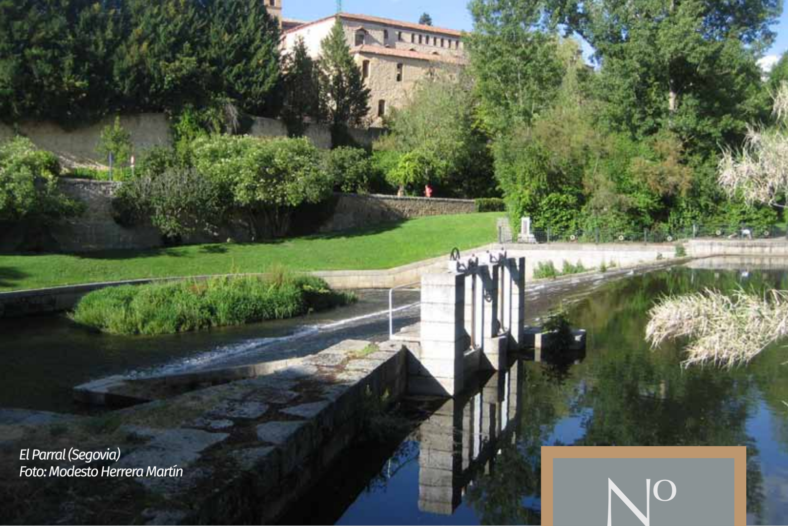
El Parral (Segovia)