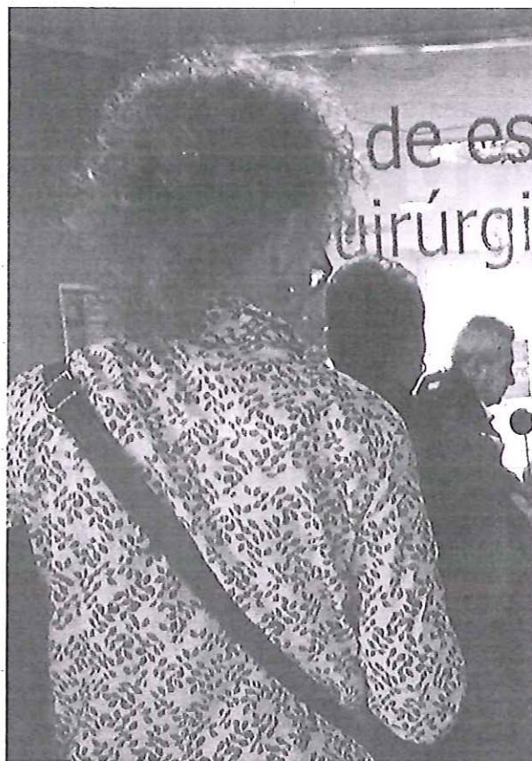
Usuarios guardan cola en la ventanilla del Hospital General dedicada a

En el capítulo de intervenciones «sencillas» entran las que están pendientes de Traumatología, que en los últimos trimestres ha sido el área asistencial más damnificada por las demoras y la acumulación de enfermos a la espera de entrar en quirófano. A finales de marzo, había 712 operaciones en cartera, 260 más que