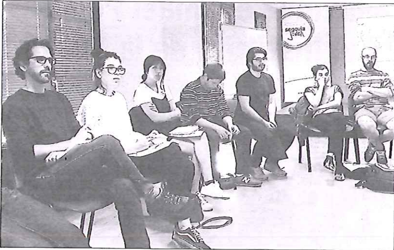
Un momento de la actividad, celebrada en la Casa Joven de Segovia.