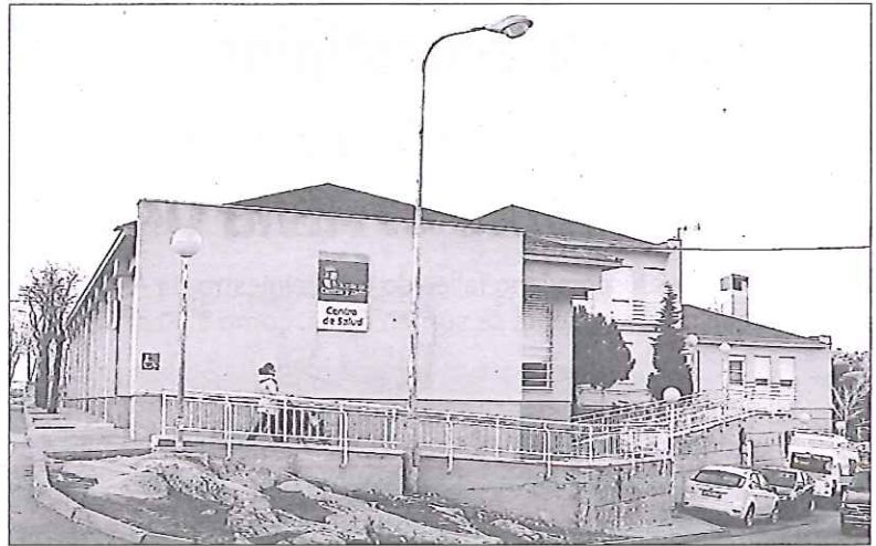
El centro de salud de El Espinar atiende a una población infantil superior a los mil niños.

Como se recordará, el año pasado, el pleno municipal de El Espinar aprobó por unanimidad una proposición conjunta de todos los grupos políticos, por la que se solicitaba que se adoptaran las medidas necesarias a fin de que se cubrieran las sustituciones de Atención Primaria de la zona de salud de El Espinar en periodos vacacionales.