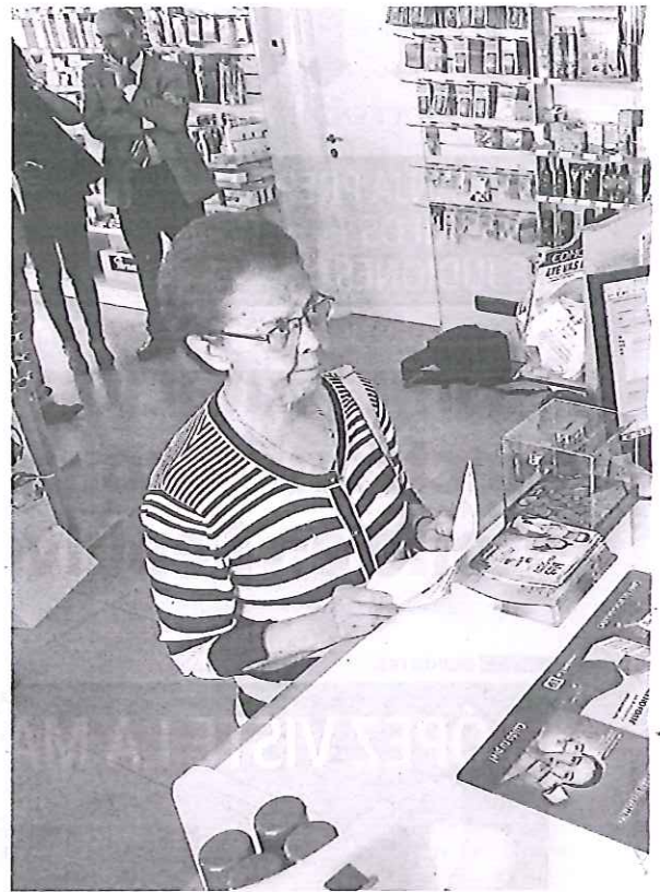
Primera paciente de Castilla y León atendida con receta electrónica en

«Esta Comunidad tiene un hándicap, que es la cantidad de puntos que hay en el territorio. Hay casi 3.500 consultorios locales que difi-