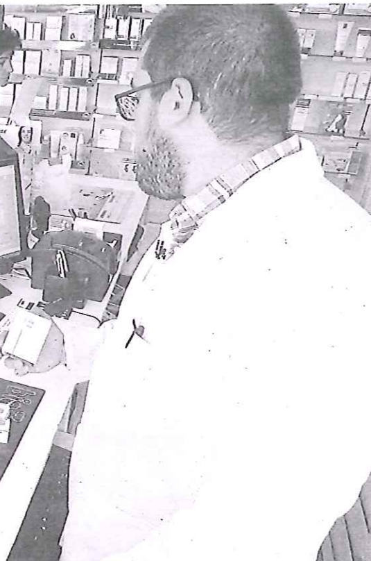
Portillo (Valladolid).

La Diputación concede al colegio profesional una ayuda económica de 8.000 euros