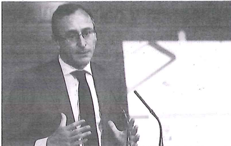
El ministro de Sanidad, Alfonso Alonso, durante su comparecencia del día de ayer en el palacio de La Moncloa.

En este sentido, Alonso insistió en que el Gobierno busca que haya un sistema "armonizado a nivel nacional" que determine cómo se atiende a este colectivo ya que España "es un país serio y las cosas se hacen forma ordenada". Por ello, defendió la creación de un registro previo en el que se inscriban a fin de obtener un documento con el cual puede recibir esa asistencia ya que, a su juicio, "no se pueden ir dando tarjetas sin control, porque es irresponsable y traía como consecuencia, antes de que se arreglara la ley, que perdiéramos 1.000 millones de euros al año por turismo sanitario" por las opciones que dejaba abiertas.