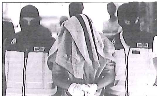
El líder de la organización captaba posibles miembros para DAESH.

ALARMA ALTA Actualmente España se encuentra en el nivel cuatro de alerta antiterrorista, lo que significa un riesgo alto en el que se alerta a las Fuerzas Armadas aunque las principales tareas dirigidas a la protección de los ciudadanos y de las infraestructuras corresponden a la Policía y a la Guardia Civil.